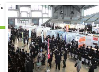
対象■2024年3月卒業予定の大(院)・短・専門・既卒など